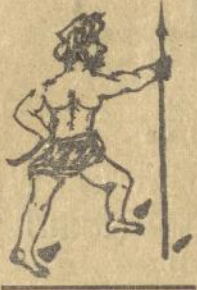
Sioel memanggil Inlanders!

Siapa tidak ketawa bila melihat actienja Appandjoenggal. Meskipun ianja soedah setengah toea, masih sebagai do li2 maradjar [moeda remadja] dipandang oerang, sebab ia tidak pernah alpa akan mentjoekoer djangoet dan koemisnja.